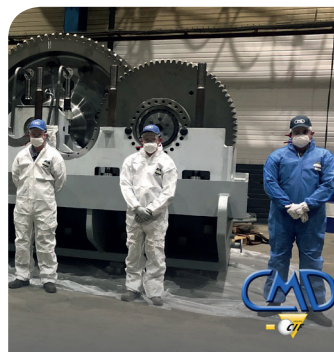
> CMD, atelier de montage

« CMD doit, plus que jamais, être à l'écoute des opportunités et s'appuyer sur son agilité, son sens de l'adaptation pour rebondir après cette lourde crise. Restons confiants, positifs et solidaires ! » ■