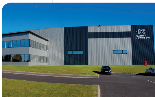
> Sahut-Conreur, fabricant d'équipements depuis 160 ans

« Il était important » souligne Frédéric Dehont, Directeur de l'entreprise , « que les équipes soient rassurées ». Il salue également l'implication de tous les salariés qui se sont appropriés et ont compris tout l'intérêt du protocole sanitaire et en particulier des gestes barrières et de la distanciation sociale. Depuis le 14 avril 2020, l'effectif est au complet et la production a repris son cours pour cette entreprise reconnue depuis plus de 160 ans comme l'un des principaux fabricants d'équipements, pour les processus d'agglomération et de compactage. ■