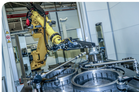
> SKF, spécialiste des roulements pour moteurs d'avions et d'hélicoptères

L'arrêt ou la suspension des contrats d'intérimaires que nous avions avant la crise (plus de 130) doit faire évoluer notre approche sur la gestion des compétences de nos collaborateurs. La polyvalence devra être développée et renforcée. Investir dans la formation et le développement des compétences aujourd'hui nous permettra d'aborder la reprise de manière renforcée !