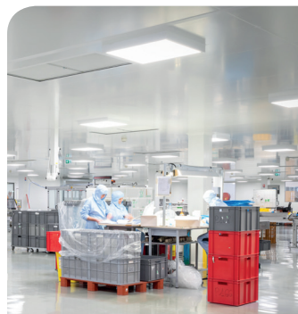
> SIPA, spécialisée dans les produits médicaux stériles

Dans ce contexte de crise sanitaire, au-delà d'un surcroît d'activité qui a permis de maintenir l'emploi, c'était aussi la satisfaction pour l'ensemble des salariés de participer à la fabrication de produits qui sauvent des vies. ■